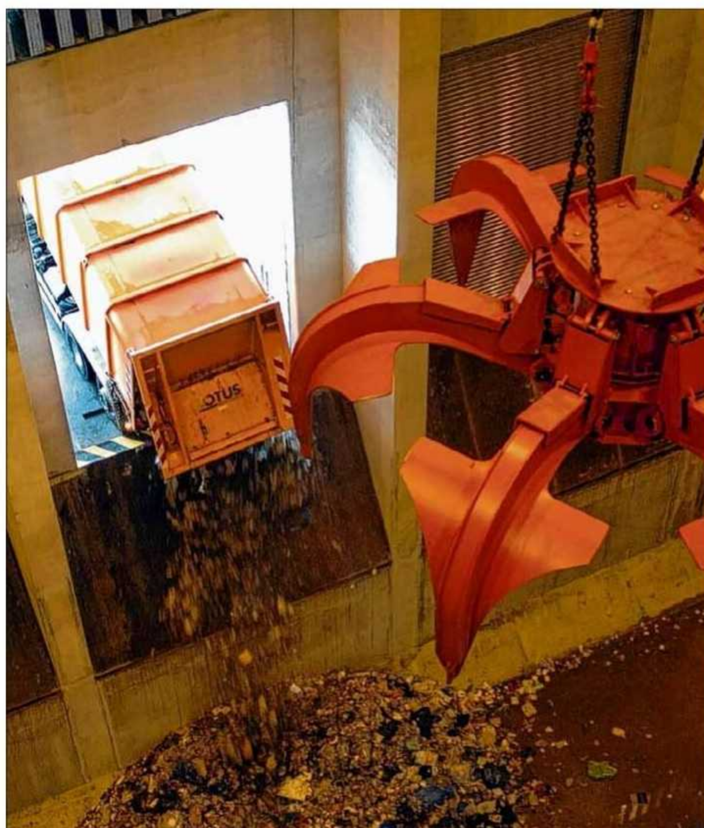
Ein Müllfahrzeug lädt im Müllheizkraftwerk ab.