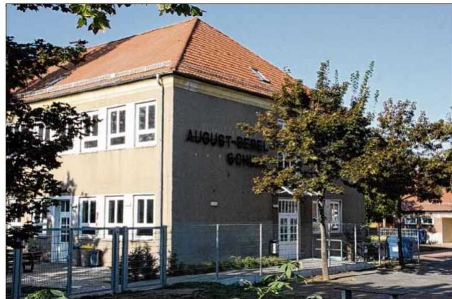
Die Stadt prüft derzeit, ob die alte Bebelschule in Rothensee für eine Hortnutzung saniert werden kann.

Laut Stadtverwaltung soll das eigentlich für Büro Zwecke genutzte Haus aber nur ein Übergangsquartier bleiben. Bei der Suche nach einer dau-