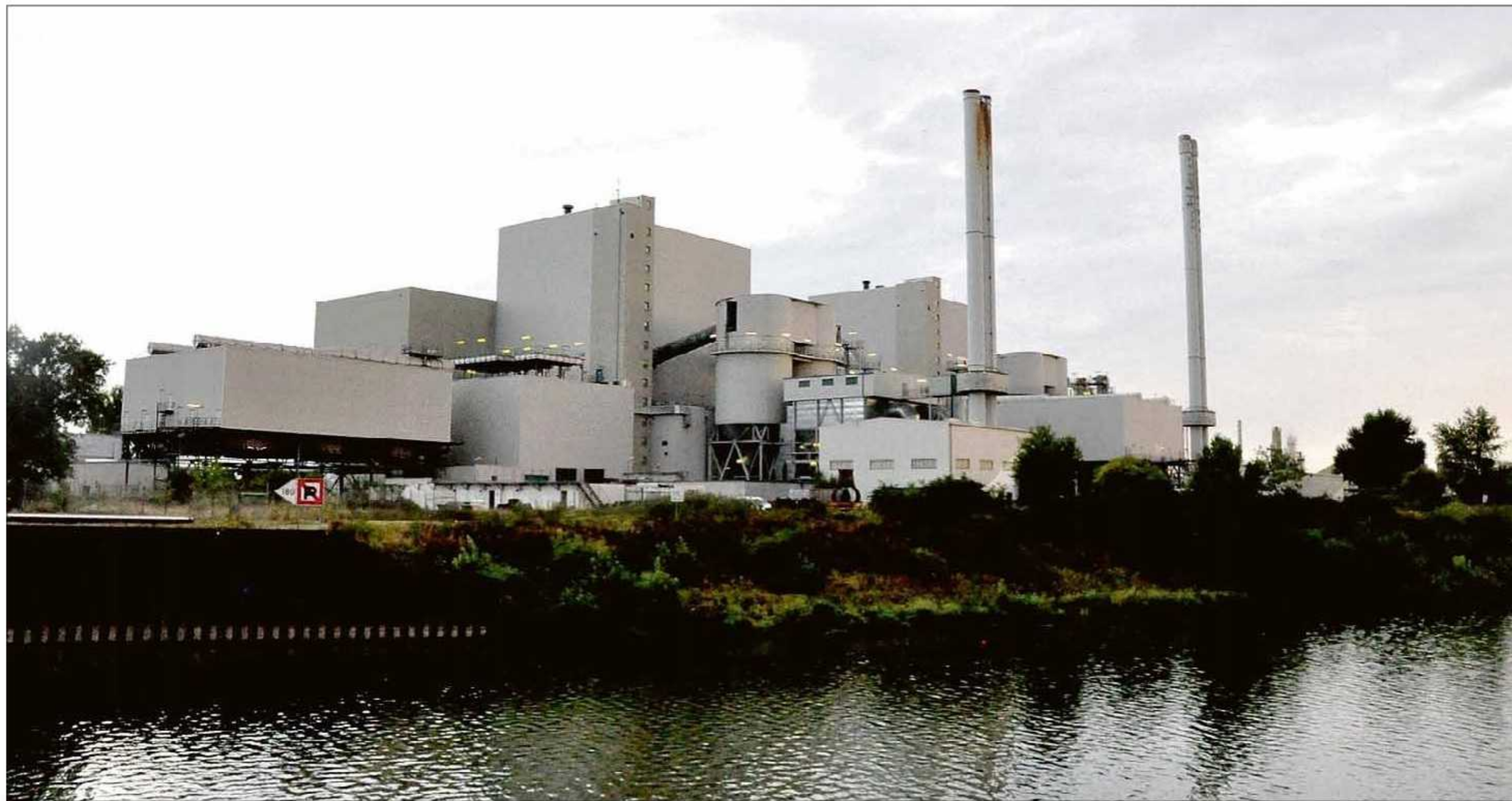
Das Müllheizkraftwerk befindet sich im Gewerbegebiet Nord an einem Hafenbecken.

Zwar hatte es in früheren Jahren bei den alten Müllver-